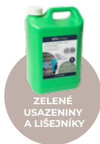
ZELENÉ USAZENINY A LIŠEJNÍKY